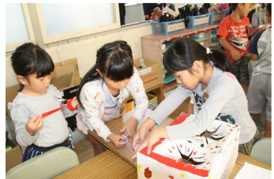
【アキレンジャーになろう！】

例えば1年生では、秋の素材を使って飾ったり、遊んだりしました。その秋の楽しさを、幼稚園の年長さんに教えようと、アキレンジャーになって活躍しました。一度目の交流では園児も困っていて、十分に教えきれずに話し合いました。二度目の交流に向けて意欲を高め、改善を進めることができました。